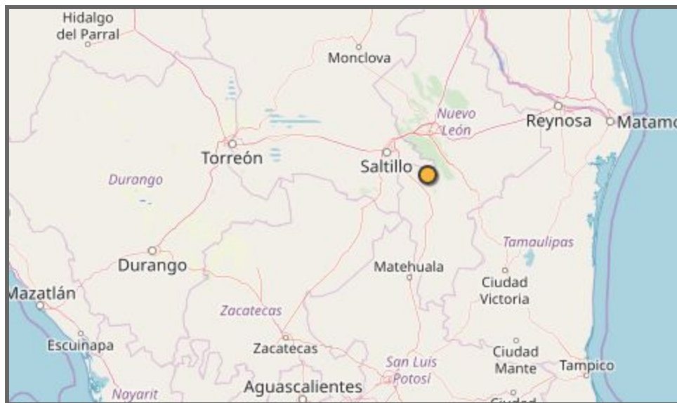
Figura 1. Epicentro del Sismo

El día 11 de junio de 2019 el Servicio Sismológico Nacional (SSN) reportó un sismo con magnitud 4.2 localizado en las cercanías de Ciudad Allende, en el estado de Nuevo León. El sismo, ocurrido a las 15:02 horas, fue sentido en las localidades cercanas al epicentro. Las coordenadas del epicentro son 25.13° latitud N y 100.37° longitud W y la profundidad es de 5 km (Figura 1).