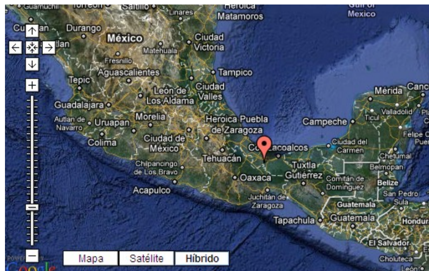
Fig 1. Epicentro del sismo.

El día 25 de febrero de 2011 el Servicio Sismológico Nacional reportó un sismo con magnitud 5.7 localizado en la costa del estado de Veracruz, a 30 km al Suroeste de Sayula de Alemán, Veracruz. El sismo ocurrió a las 07:07 horas, tiempo del centro de México. Las coordenadas del epicentro son 17.76 latitud N y 95.21 longitud W (fig 1). Hasta el momento de la emisión de este reporte no se tienen informes de daños, pero el sismo sí fue sentido en diferentes localidades del estado de Veracruz y en la Ciudad de México.