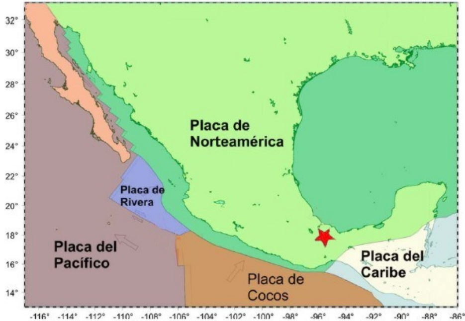
Figura 3. Tectónica de la República Mexicana. La estrella en color rojo indica el epicentro del sismo.

El mecanismo focal de este sismo, obtenido en el Servicio Sismológico Nacional se observa en la figura 4 y presenta un rumbo = 150, echado = 50 y deslizamiento = 107.